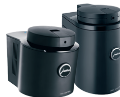
Cool Control Basic 0,6 literes, fekete 1,0 literes, fekete