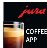
JURA Coffee App Letölthető a weboldalunkról